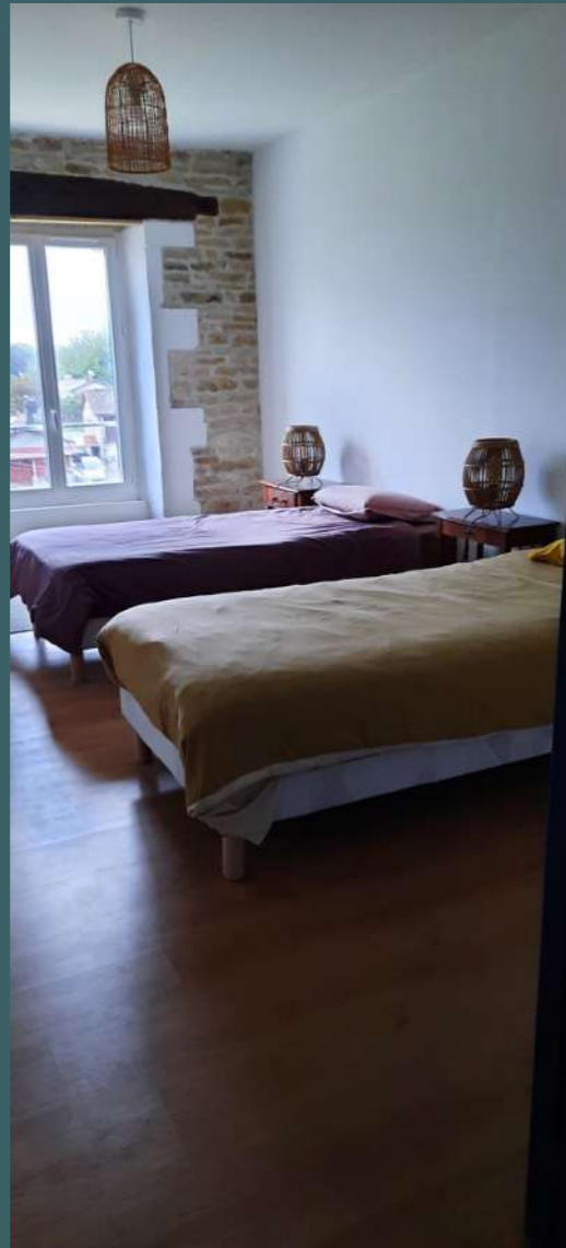
chambre N°2 2 lits 90 cm