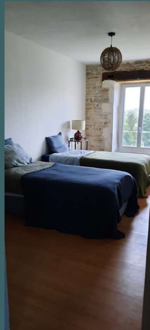
chambre N°3 2 lits 90 cm