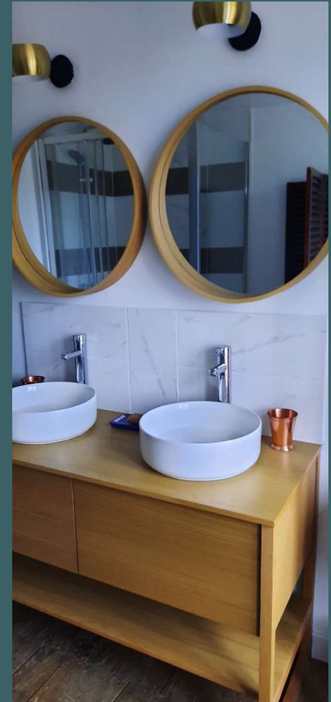
salle de bain/douche/wc