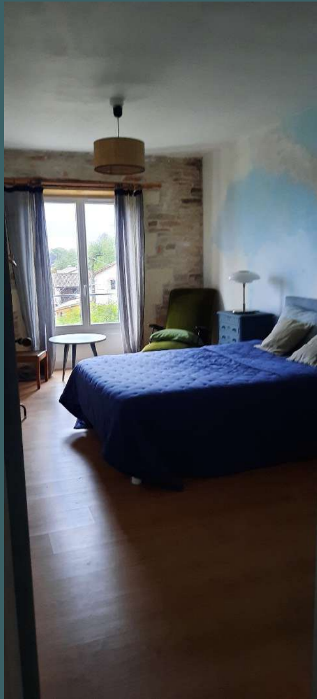
chambre N°4 | lit double | 140cm

Situé au 2ème étage de notre maison, l'appartement dédié à l'accueil des artistes est composé de 5 chambres, un espace cuisine équipée/salle à manger/salon et une salle de bain/wc. Linge de lit fourni.