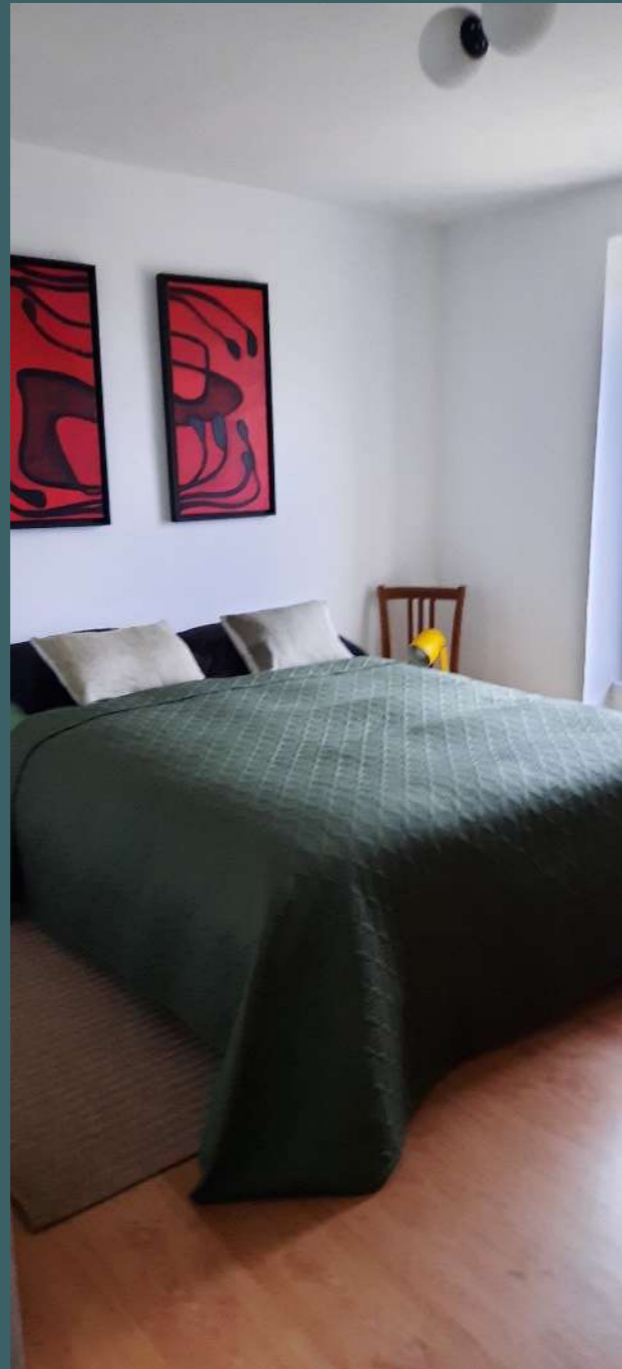
chambre N°5 | lit double | 140 cm