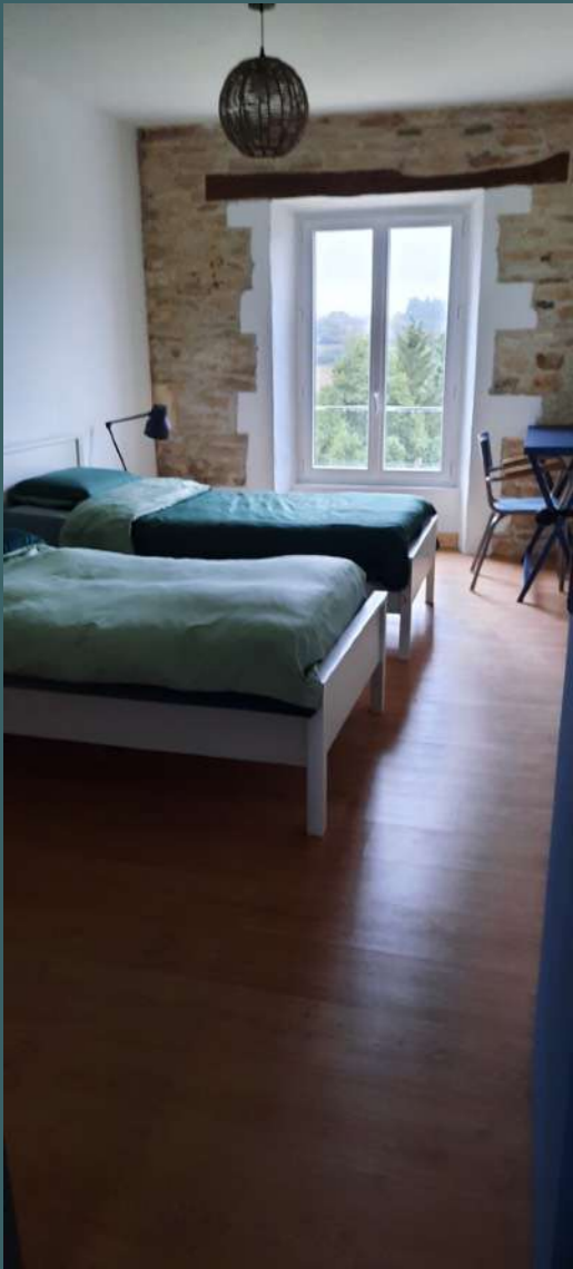
chambre N°1 2 lits 90 cm