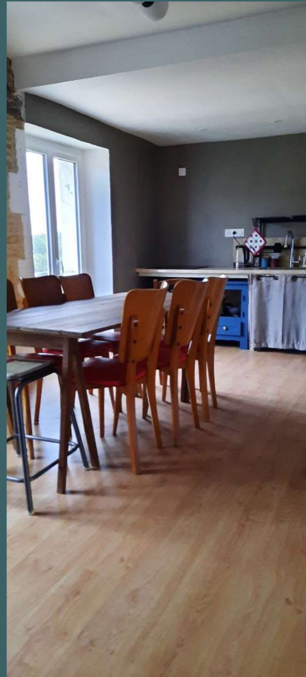
cuisine/Salle à manger